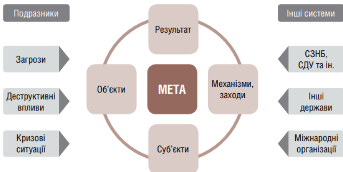
Рис. 1.1. Система забезпечення національної стійкості у взаємодії із зовнішнім середовищем [2, с.48]

Існування щільних зв'язків і взаємовпливів між об'єктами та суб'єктами зумовлює складний комплексний характер заходів, спрямованих на формування національної стійкості, які мають охоплювати політичні, економічні, соціальні, інформаційні, психологічні та інші аспекти. Такі зв'язки реалізуються через цілеспрямовані дії, відповідні методи, чинники, механізми. При цьому можуть формуватися і нові зв'язки, що сприятимуть розвитку основних об'єктів та системи забезпечення національної стійкості загалом, і додаткові чинники негативного впливу. Взаємодія суб'єктів та об'єктів зумовлена певною метою та спрямована на отримання таких результатів, як зниження ризиків та наслідків настання кризових ситуацій, забезпечення безперервності функціонування держави та суспільства за будь-яких умов [2, с.47]. Схематично взаємодія між основними елементами системи забезпечення національної стійкості та із зовнішнім середовищем представлена на рис. 1.1.