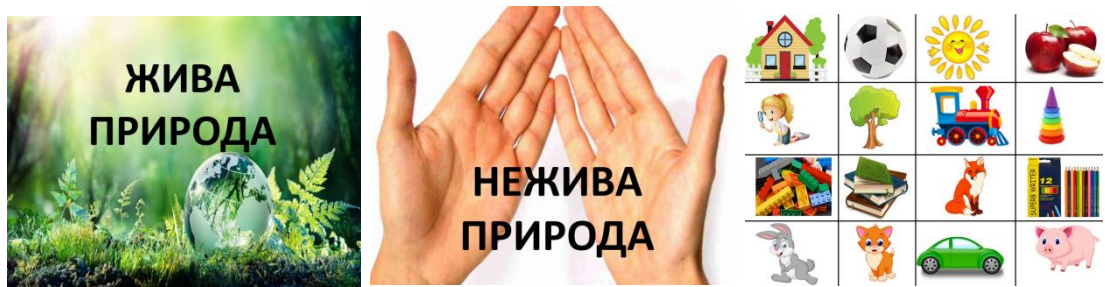
Рис. 2. Гра «Жива чи нежива природа»