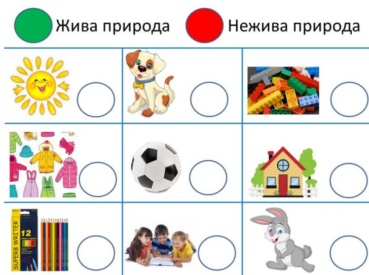
Рис. 1. Завдання на визначення живої та неживої природи

Для цього заняття було виготовлено дидактичний матеріал: завдання з визначенням живої та неживої природи (Рис. 1) та гру «Жива чи нежива природа» (Рис 2.).