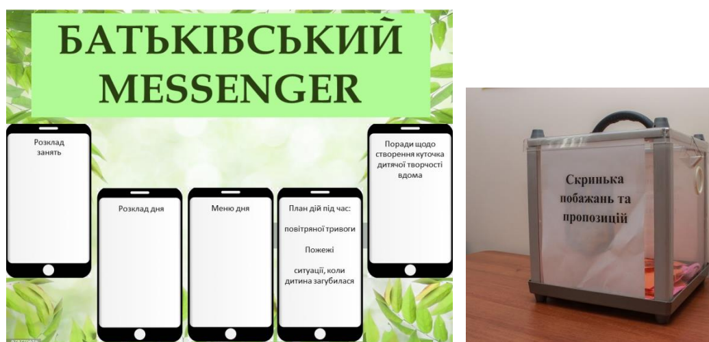
Рис. 5. Оформлення батьківського куточка

Орієнтовний план-вигляд (задум) батьківського куточка, який був розроблений (Рис. 5).